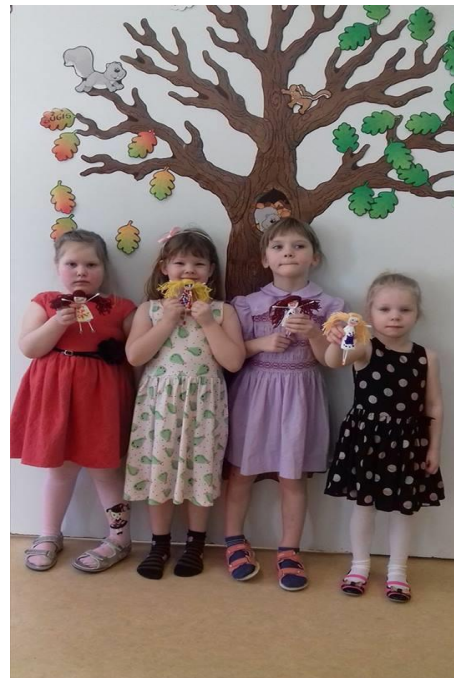
Valik fotosid toredast päevast