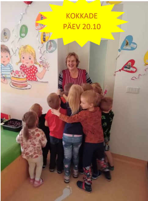
KOKKADE PÄEV 20.10