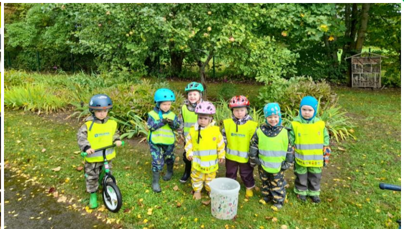
...PALJU ÕUES VIIBIDA...