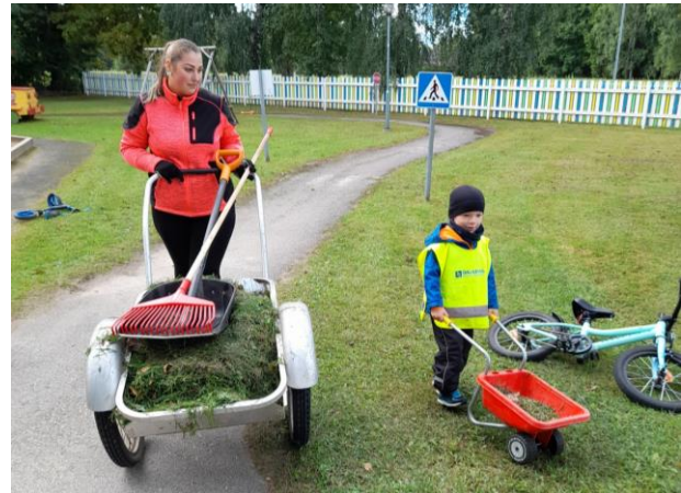
...LAUSA IGA ILMAGA!