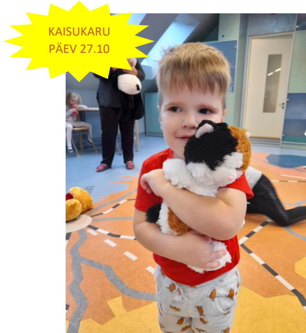
KAISUKARU PÄEV 27.10