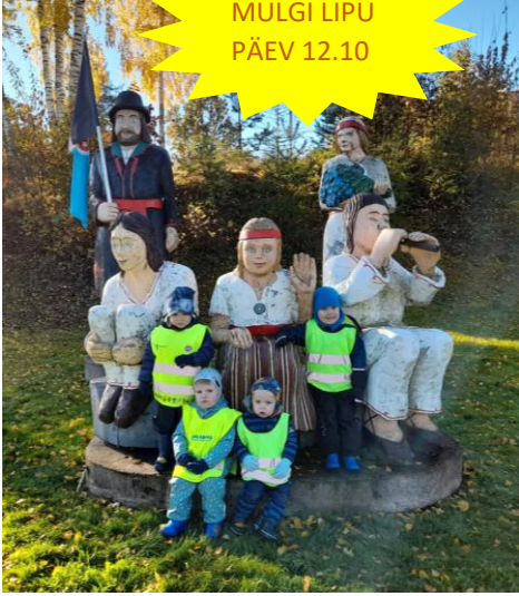
MULGI LIPU PÄEV 12.10