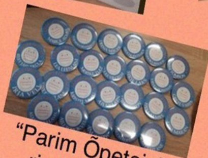
"Parim Õpetaja" rinnamärgid