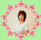
Lii Andriainen õpetaja abi