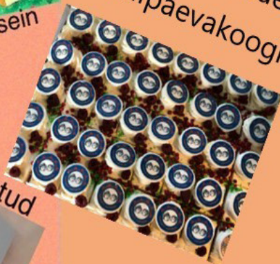
Tarvastu Lasteaed 5 sünnipäevakoogid