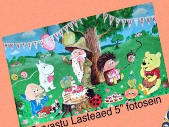
"Tarvastu Lasteaed 5" fotosein